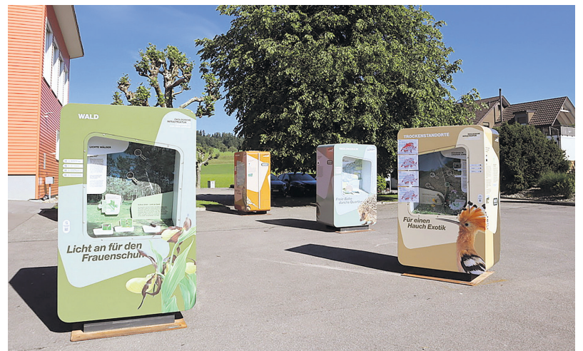
Die Ausstellung auf dem Pausenplatz ist noch bis zum 31. Mai zu besichtigen.